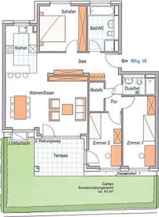
Grundriss (ohne Maßstab)

Unverbindliche Illustration Änderungen vorbehalten